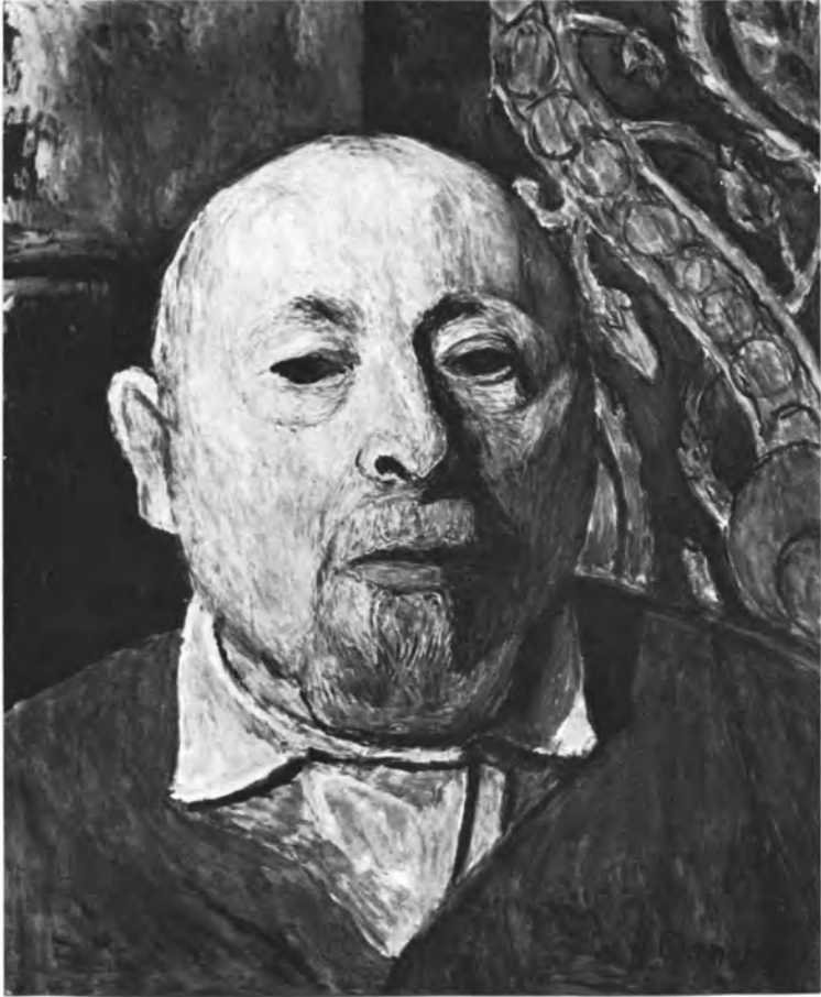
SELBSTPORTRÄT, MONTAGNOLA 1961