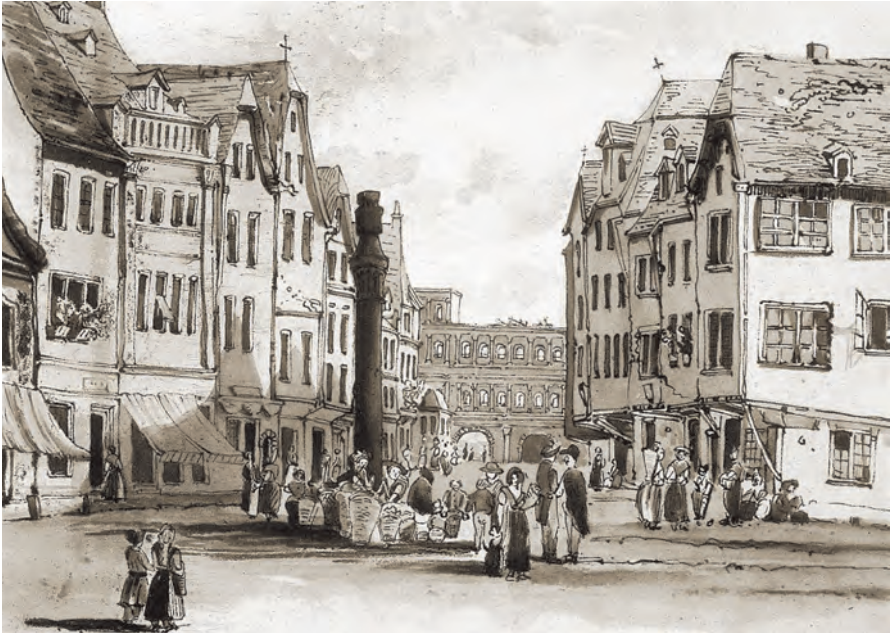
Abb. 4: Die Simeonstraße in Trier um 1835 (Verkehrsamt der Stadt Trier, von Heinz Monz, Karl Marx und Trier, Trier: Druckerei und Verlag Neu, 1964)

Minderheit von Trier. Durch die französische Annexion des Rheinlandes profitierten die Trierer Juden zunächst von den revolutionären Emanzipationsgesetzen. Schon 1808 wurde ihre Gleichstellung allerdings durch Napoleons Décret infame wieder eingeschränkt. Dieses Dekret (wie viele andere französische Gesetze) blieb auch in Kraft, nachdem das Rheinland preußisch geworden war. 1818 wurde es durch eine weitere Bestimmung ergänzt: Juden wurde es verboten, ein Regierungsamt zu bekleiden.