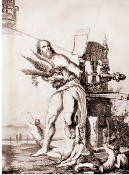
Abb. 7: Marx als Prometheus

Ausdruck natürlich bei Shakespeare verliehen wurde), die ihre Rollen spielten, die die Geschichte ihnen zuwies. Oft wird die literarische Interpretation zur Metapher für die philosophische Analyse. So bezeichnet Marx seine Kritik an Hegels Rechtsphilosophie aus dem Jahr 1843 als eine Übersetzung von Hegel in Prosa, also eine Übersetzung von Hegels idealistischen Kategorien in eine Sprache, die die soziale Realität erfassen konnte.