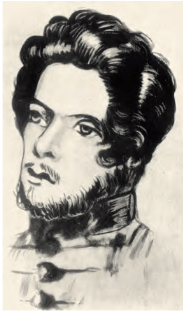
Abb. 1: Karl Marx im Jahre 1836 (International Instituut voor Sociale Geschiedenis, Amsterdam, von Heinz Monz, Karl Marx und Trier, Trier: Druckerei und Verlag Neu, 1964)

gehörte. Nach seiner mündlichen Prüfung konnte der Lehrer nur feststellen, daß »Marx sich mit Allgemeinen ziemlich bekannt« zeigt. 5