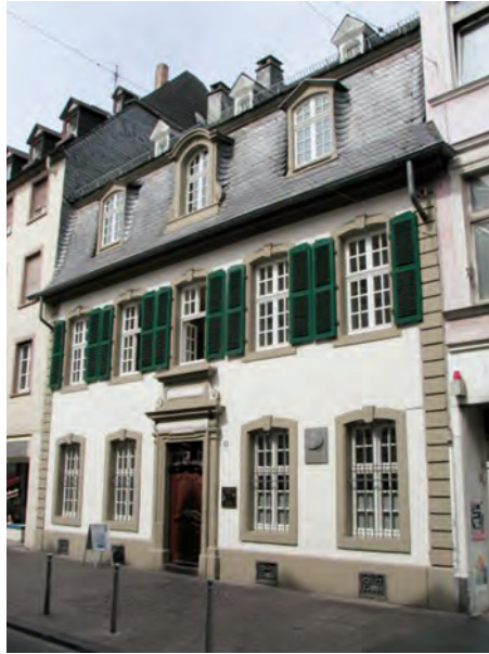
Abb. 3: Geburtshaus von Karl Marx

stand in dem Ruf, mehr Kirchen als jede andere deutsche Stadt vergleichbarer Größe zu haben.