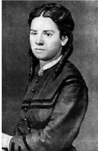
Abb. 6: Jenny Marx