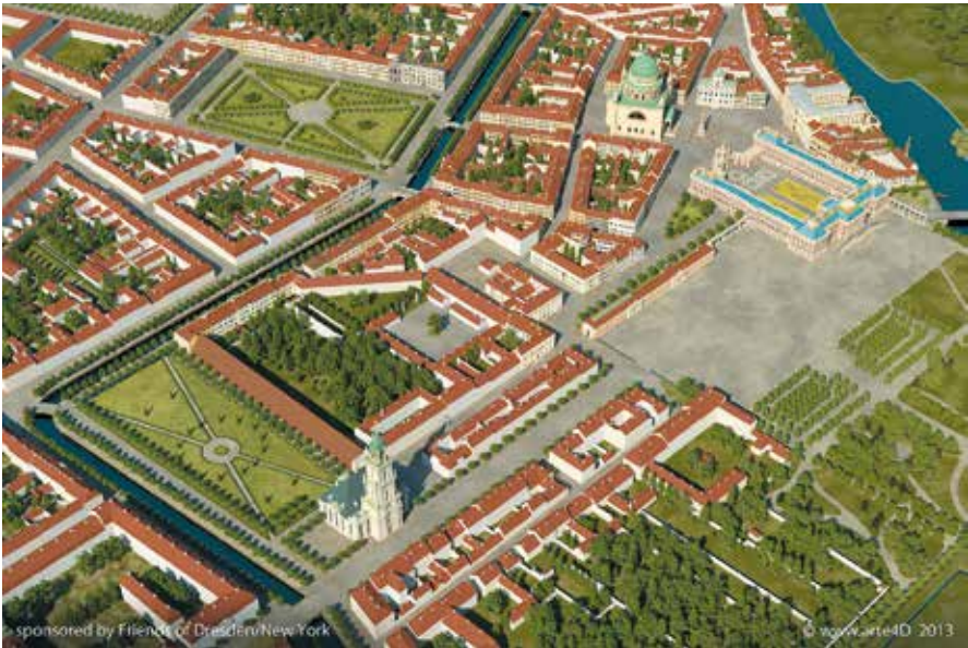
Abb. 9: Die Potsdamer Mitte von Südwesten, computergraphische Darstellung des Gesamtmodells

Durch sehr nennenswerte Mittel der Friends of Dresden wurde nun Schritt für Schritt die Visualisierung des Wertes der historischen Potsdamer Mitte in ganz neuer Form durch die Dresdner Firma Arte4D möglich. Die Bilder sind mittlerweile zu einer Internetplattform zusammengeführt.