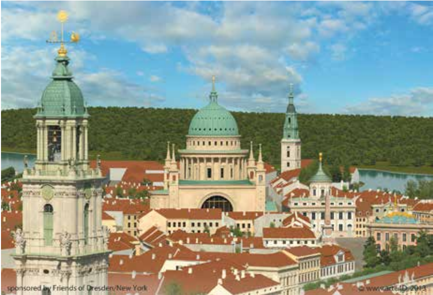
Abb. 1: Potsdams »Dreikirchenblick«

denz – anfangs seinen Architekten gegenüber noch halbwegs psychologisch rücksichtsvoll – umsetzen, und es entstand ein gebautes Architekturlexikon in Potsdam. Selbstverständlich blieb schon den zeitgenössischen Betrachtern die Diskrepanz zwischen dem nicht vorhandenen Reichtum der Bewohner und dem Anspruch der Fassaden nicht verborgen. Abgesehen vom persönlichen Spleen und dem Trachten nach königlichem Prestige: Der Erziehungszweck, nämlich das allgemeine Bauniveau langsam auf internationale Standards zu heben, erfüllte sich nach und nach.