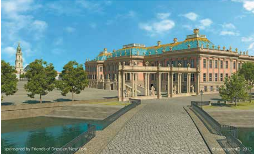
Abb. 8: Blick von der Langen Brücke auf Stadtschloß und Garnisonkirche