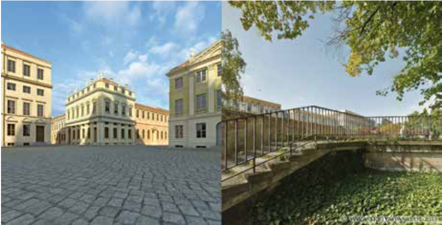
Abb. 2: Kaiserstraße, Ecke Alter Markt um 1850 und 2012. Das mittige Eckgebäude war eines jener palladianischen Palastzitate aus friderizianischer Zeit.