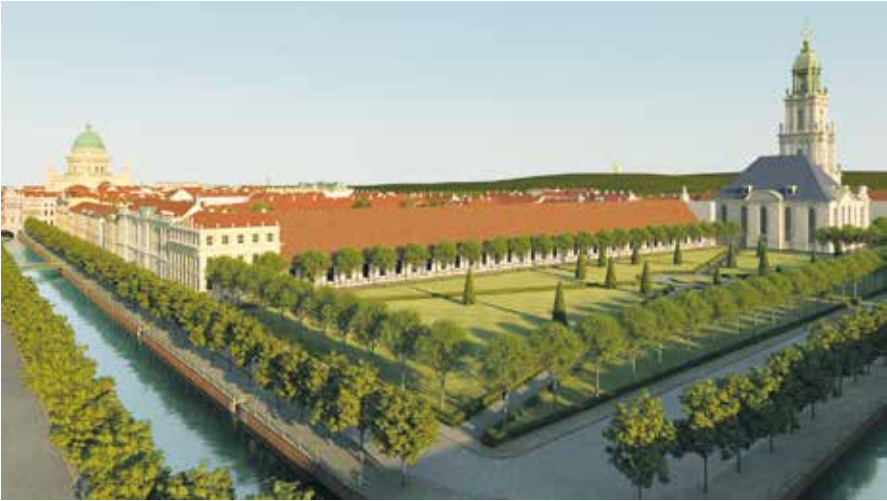
Abb. 13: Blick über die Plantage nach Osten mit Langem Stall und Garnisonkirche (abgerissen 1968) und Front am Stadtkanal mit Brockschem Haus.

einer breiten gesellschaftlichen Diskussion, die ganz wesentlich von den Bürgerinitiativen angestoßen wurde. Dieses Ernstnehmen von Partizipation blieb naturgemäß auch innerhalb der Bürgerschaft nicht ohne Kritik, da auch in Potsdam allein der Gedanke an die Rekonstruktion von Baudenkmälern in Form einer »Erinnerungsarchitektur« vielfach pathologisch allergische Abwehrreaktionen hervorruft. Vielleicht war »Mitteschön« daher gut beraten, sich immer auch als Anwalt für qualitätvolle, dem genius loci angemessene und damit im doppelten Wortsinn rücksichtsvolle neue Architektur zu verstehen.