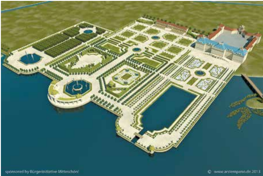
Abb. 10: Stadtschloß und Lustgarten vor 1713

lich und bleiben ein entscheidendes Argument für die zukünftige Entwicklung. Diese Bilder wurden vielfach publiziert, diskutiert und lösten in der Öffentlichkeit einen Aha-Effekt aus; eine Aufklärungsarbeit, die sogar Wirkung bis in die wissenschaftliche Welt hinein entfaltete. Völlig in Vergessenheit geraten war etwa die Tatsache, daß bis 1713 der Potsdamer Lustgarten die früheste Rezeption der Versailler Vorbilder gewesen war, und zwar in einer Opulenz, die sich für diesen frühen Zeitpunkt in keiner anderen Residenz im Deutschen Reich nachweisen läßt. Die eigentlich für eine tagesaktuelle Debatte – die Stadt Potsdam hat vor, diesen heute modern gestalteten ältesten öffentlichen Garten teilweise zu überbauen – gedachten Bilder haben einen Anstoß für die aktuelle gartenhistorische Forschung gegeben.