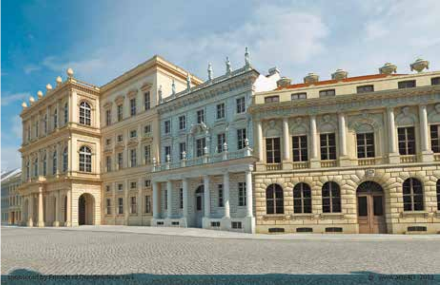
Abb. 11: »Friderizianische Architekturzitate«: Palazzo Barberini (Rom), Palazzo Chiericati (Vicenza), Palazzo Pompei (Verona)

schaftlichen, im besonderen aber auch akademischen Debatte wieder, die sich schon im letzten Drittel des 19., virulent dann an der Schwelle zum 20. Jahrhundert entzündet hatte und zunächst von den denkmaltheoretischen Überlegungen etwa von Alois Riegl oder Georg Dehio ausging. Über einhundert Jahre später ist die Debatte um vieles schärfer geworden, wobei die Einwände der Kritiker von »Geschichtsklitterung« bis hin zur Warnung vor dem »Disney-Land der Städte« reichen, was auch noch der notorisch notleidenden Denkmallandschaft die Ressourcen entziehe: »falsche Schlösser graben den echten das Wasser ab«.