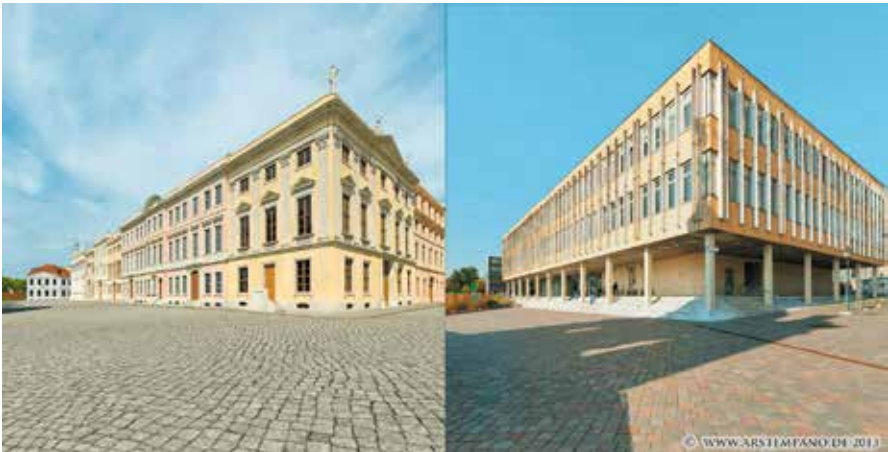
Abb. 3: Schloßstraße, Ecke Alter Markt um 1850 und 2012