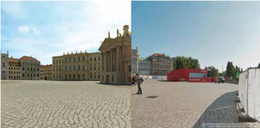
Abb. 6: Ostseite des Alten Marktes um 1850: »Knobelsdorff-Haus« (nach Marble Hill Haus, London), Palast Barberini (nach römischem Vorbild) und östlicher Kopfbau des Stadtschlusses. Rechts: Situation 2012

ist nicht bekannt. Deutlich abgelehnt wurde der Vorschlag, wenigstens die Option einer Rekonstruktion von Innenräumen für die Welt von morgen offenzuhalten. Daß diese Räume bestens dokumentiert sind, ihre Ausstattung größtenteils erhalten ist und mit ihnen die Einführung der allgemeinen Schulpflicht, die Abschaffung der Folter und der Pressezensur, die Ideen von Rechtsstaatlichkeit, religiöser Toleranz, verkürzt gesagt ein zentraler Knoten der europäischen Geschichte und der europäischen Aufklärung, verbunden war, hatte für die Landesregierung offenbar keine Bedeutung.