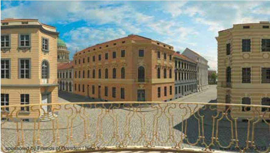
Abb. 15: Der Potsdamer »Acht-Ecken-Platz«, Blick nach Süden.

Sämtliche Gebäude wurden nach dem Krieg abgerissen, der Straßenzug autogerecht verbreitert. Die einzig erhalten gebliebene Ecke (Betrachterstandpunkt) wird gegenüberliegend links mit einem Leitbau nach historischem Vorbild komplettiert.