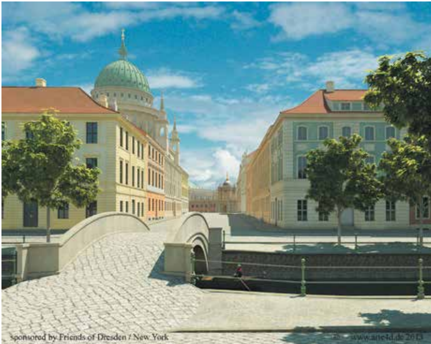
Abb. 14: Blick durch die Kaiserstraße zum Stadtschloß.

Nach 1945 wurden sämtliche kriegsbeschädigten Gebäude abgerissen, der Straßenzug aufgegeben.