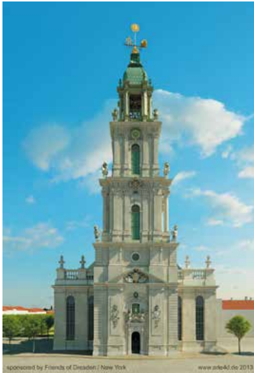
Abb. 4: Potsdamer Garnisonkirche, abgerissen 1968

begannen die Abrisse in der zentralen Breiten Straße, bis 1965 wurde der Potsdamer Stadtkanal, der in niederländisch anmutender Weise das gesamte Stadtzentrum durchzog, zugeschüttet. 1968 fiel die kriegsversehrte Garnisonkirche, sechs Jahre später die Reste der Heiliggeistkirche. Bis 1989 verschwanden ganze Straßenzüge intakter barocker Bauten.