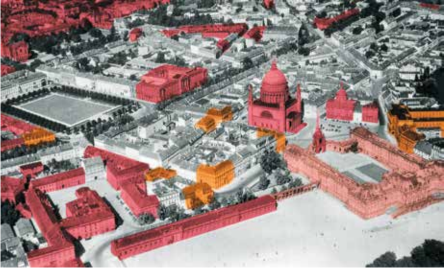
Abb. 7: Die Potsdamer Mitte. Grau unterlegt: nach 1945 abgerissen, gelb: Leitbautenvorschläge, rot: historischer Bestand.

© Christopher Kühn und Hans-Joachim Kuke