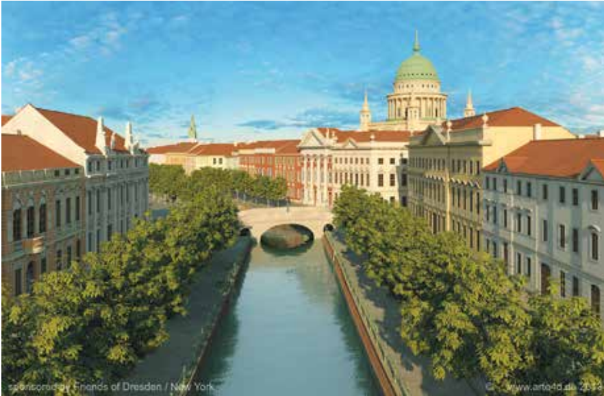
Abb. 12: Blick über den Stadtkanal nach Osten mit Alter Post und »Probenhaus«, einer Paraphrase von Huis Trip, Amsterdam (Justus Vinboons, 1655 ff.). Bis auf eines wurden alle dargestellten Bürgerhäuser in den 1950er Jahren niedergelegt.

Leitbau zurück, und zwar an der Stelle, an der geschichtlich die später zeitweilig europäische Bedeutung der Stadt und der Region begann. Kunsthistorisch betrachtet wird der Bau keine »Rekonstruktion«, nicht einmal eine Teilkopie. Die Vielzahl von Unkenntnis und Arroganz geschuldeter, unnötiger, der einstigen Schönheit abträglicher Manipulationen im Großen wie im Kleinen wird vor der Geschichte ein Dokument brandenburgischen Regierungshandelns am Anfang des 21. Jahrhunderts werden. Eines aber läßt sich bereits jetzt feststellen. Der regierungsamtliche Begriff »Landtagsneubau« konnte sich nie durchsetzen. Die Bevölkerung spricht vom »Stadtschloß«, und schon das Richtfest Mitte November 2011 wurde mit über 10.000 Menschen zu einer überwältigenden Zustimmungsbekundung. Wenn nun auch in der Potsdamer Mitte, den Quartieren unmittelbar um den Landtag, »Leitbauten« entstehen sollen, ist dies das Ergebnis